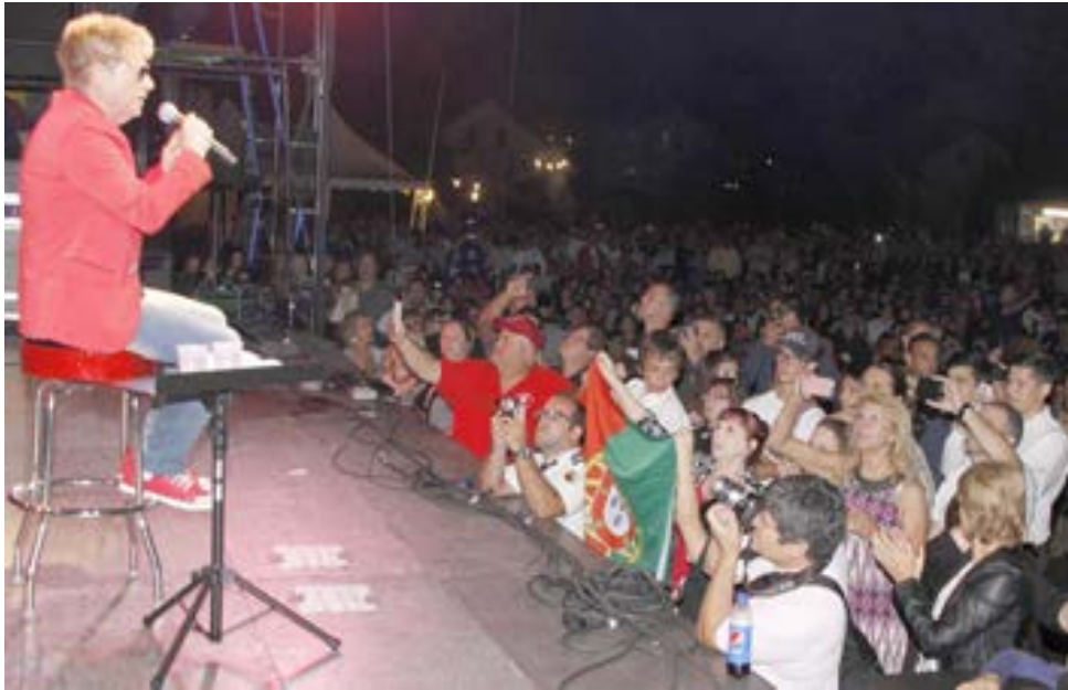
Roberto Leal foi a grande atração musical das Grandes Festas em Fall River, com uma atuação soberba no domingo.

Milhares de pessoas vibraram. Aplaudiram. Fizeram coro aos grandiosos êxitos de Roberto Leal. A sua entrada em palco não foi o esperado. O rapazinho de fato branco não entrou aos saltos. Entrou vagorosamente. E de óculos escuros. Problemas de saúde limitaram o artista, que mesmo assim não deixou por mãos alheias os louros conquistados ao longo de uma carreira recheada dos maiores êxitos. Êxitos que desfilaram pelo Kennedy Park, com uma assistência record em domingo de