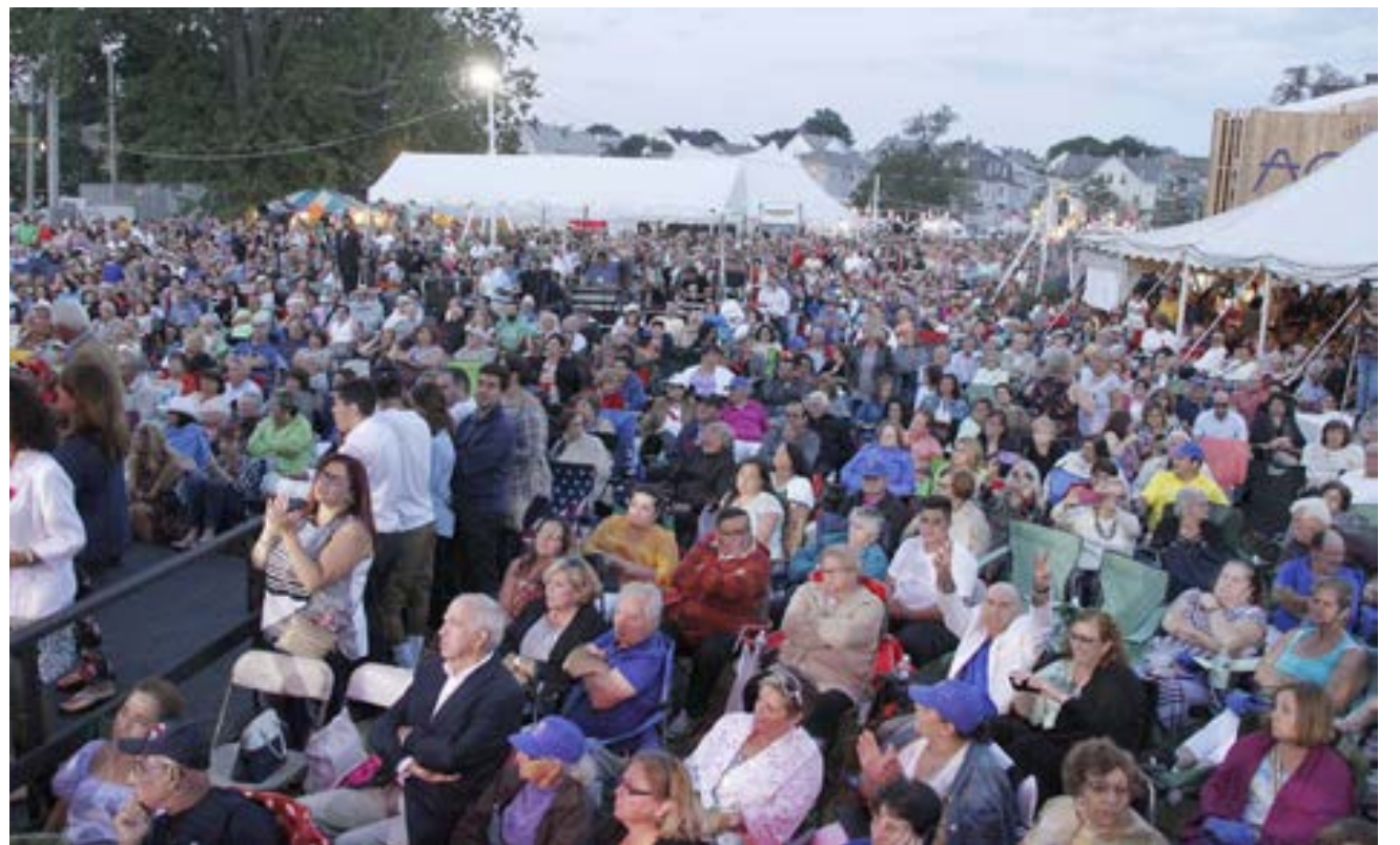
Na foto acima um aspeto da multidão presente no arraial de domingo das Grandes Festas do Espírito Santo da Nova Inglaterra no Kennedy Park em Fall River.