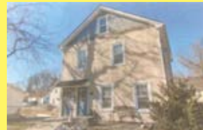
2 famílias RIVERSIDE $229.900