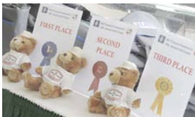
Os três prémios do torneio.