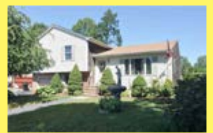
3 andares RUMFORD $309.900