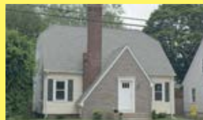
Cape RIVERSIDE $224.900