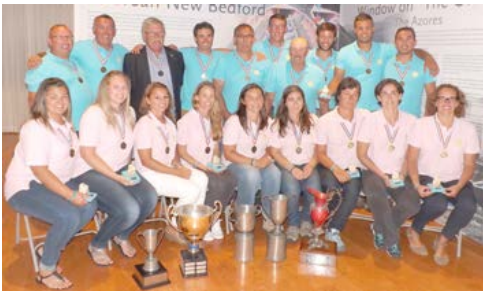
As equipas masculina e feminina do Clube Naval da Horta, Faial, grandes vencedoras desta nona regata internacional de botes baleeiros.