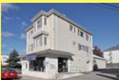
Comercial/2famílias NORTH FALL RIVER $269.900