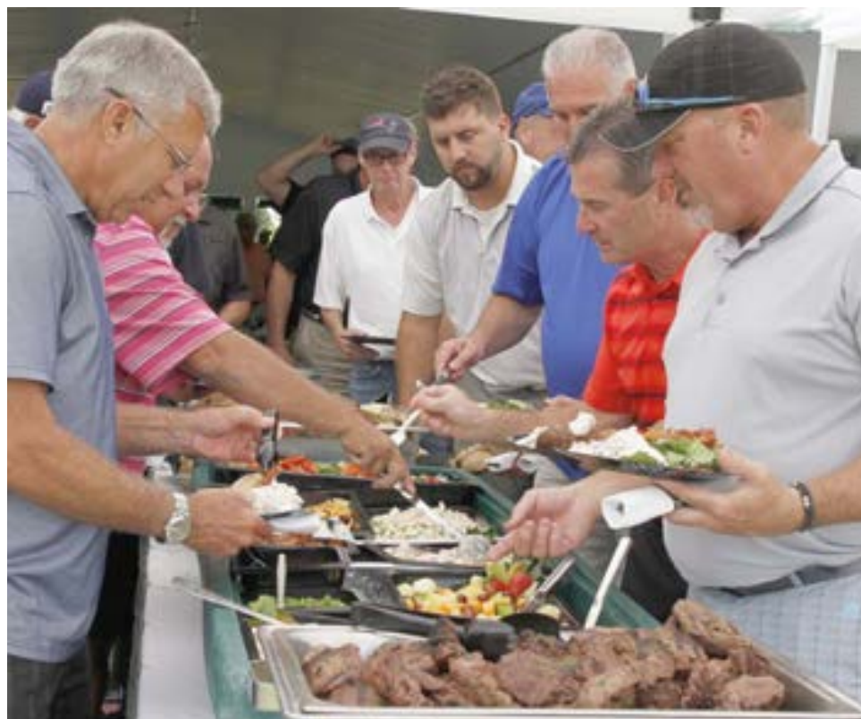
As três fotos documentam o serviço de buffet aos golfistas e público em geral que ocorreu ao X Torneio de Golfe promovido pela firma S&F Concrete Contractor em benefício do Hudson Portuguese Club, realizado na passada quinta-feira em Northborough.