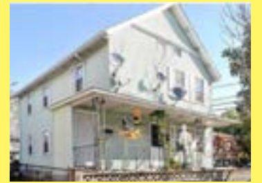
2 famílias EAST PROVIDENCE $189.900