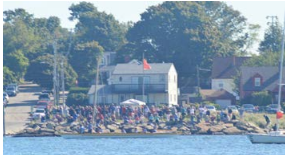
As fotos documentam várias fases da prova feminina de vela, na manhã do passado sábado na baía de New Bedford entre as três equipas em prova: Faial, Pico e EUA. Na foto acima um aspeto do público que assistiu à regata e na foto à direita, a equipa do Faial tripulando o bote “Bela Vista”.