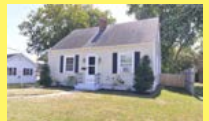
Cape EAST PROVIDENCE $199.900